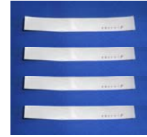
MKC-28N (2種1組 封印シール4枚付属)