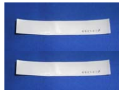
付属品：連番付き透明封印シール

サミーの「攻殻機動隊 S.A.C 2nd GIG」や「エウレカセブンAO」等の主基板制御に移行された機種で、リール上部基板ケース内への仕込みゴトが多発していますが、今後は接続ケーブルへの仕込みに手口変化する可能性があります。