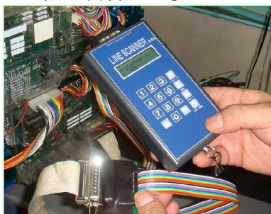
CRユニット基板検査例

オプション基板を装着する事により「 CRユニット 」 接続ライン への仕込み基板も検査が可能です。