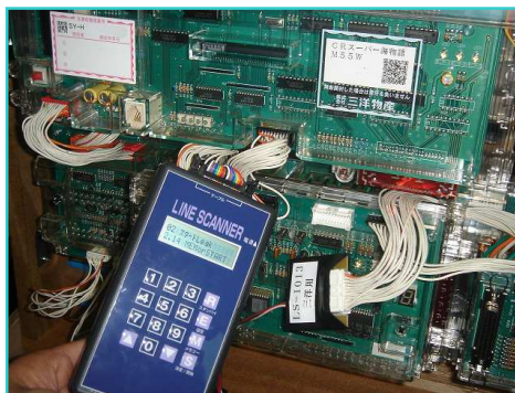
大海スペシャル アウトライン検査例

今般、遊技台の 不正ハーネス・外付基板 による被害が横行しております。「LINE SCANNER」は簡単な操作でハーネス検査等を行い、正否判定を表示します。スタートを經由しない外付基板や（アウトライン検査）、特殊な割り込みハーネス（スタートリーク）検査も可能です。