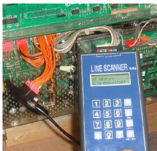
ニューギン検査例